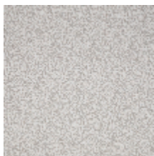
4268-01 LEONTINE - NATUREL