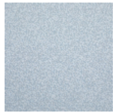
4268-06 LEONTINE - CIEL