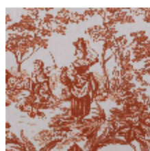
4269-01 BELLE SAISON - TERRACOTTA