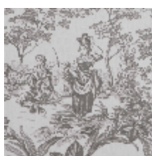
4269-03 BELLE SAISON - CENDRE