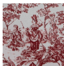
4269-05 BELLE SAISON - GRENAT