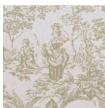
4269-02 BELLE SAISON - TILLEUL