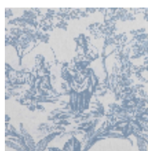
4269-04 BELLE SAISON - FAÏENCE