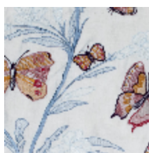
4270-02 FLANERIE - BOUDOIR