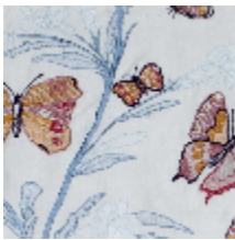
4270-02 FLANERIE - BOUDOIR