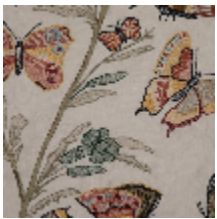
4270-01 FLANERIE - PRINTEMPS