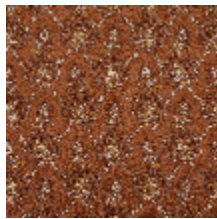
4281-03 OMBELLE - SIENNE