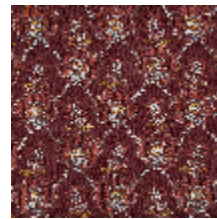
4281-05 OMBELLE - GRENAT