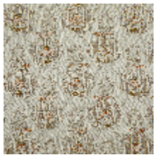
4281-01 OMBELLE - NATUREL