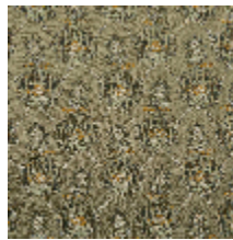
4281-04 OMBELLE - KAKI