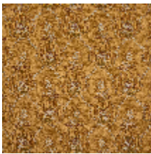
4281-02 OMBELLE - MORDORE