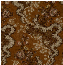
4285-02 MELODIE - BRONZE