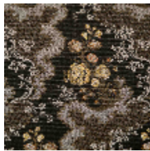
4285-03 MELODIE - KAKI