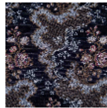
4285-05 MELODIE - NUIT