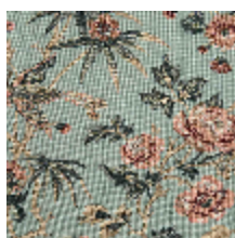
4287-03 COQUETTE - AZUR