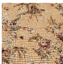
4287-02 COQUETTE - FLEUR D'ORANGER