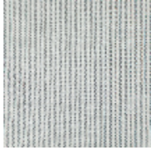
4290-01 COMTESSE - ONYX