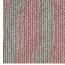
4290-05 COMTESSE - PETALE