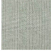
4290-03 COMTESSE - AMANDE