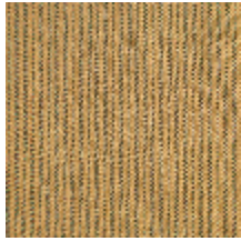
4290-07 COMTESSE - MORDORE