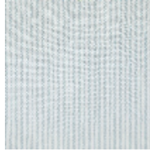
4290-04 COMTESSE - NATTIER