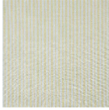
4290-02 COMTESSE - JONQUILLE