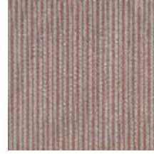
4290-05 COMTESSE - PETALE