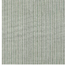
4290-03 COMTESSE - AMANDE