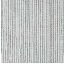
4290-01 COMTESSE - ONYX