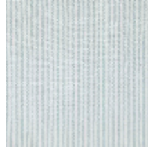
4290-04 COMTESSE - NATTIER