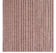
4290-06 COMTESSE - VIOLINE