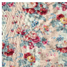
4291-03 RITOURNELLE - PETALE