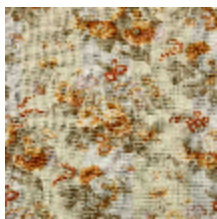
4291-01 RITOURNELLE - SOLEIL