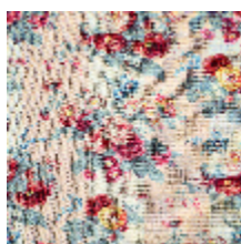
4291-03 RITOURNELLE - PÉTALE