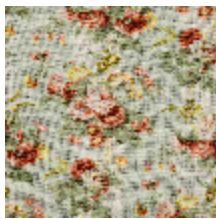
4291-02 RITOURNELLE - AMANDE