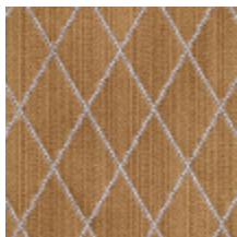
0484-19 FILIN - GOLD *