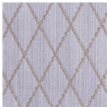
0484-13 FILIN - MAUVE *