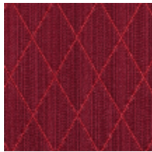
0484-09 FILIN - CARMIN