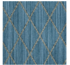
0484-12 FILIN - ARDOISE