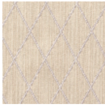
0484-02 FILIN - IVOIRE