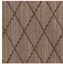
0484-04 FILIN - SYCOMORE