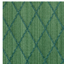
0484-17 FILIN - FORET