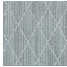
0484-05 FILIN - ARGENT