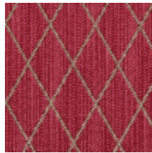
0484-10 FILIN - GIROFLEE