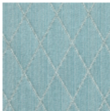
0484-14 FILIN - NATTIER