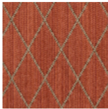
0484-08 FILIN - CUIVRE