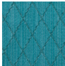
0484-16 FILIN - MALACHITE