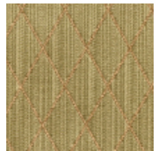
0484-18 FILIN - CHARTREUSE