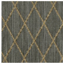
0484-07 FILIN - ACIER