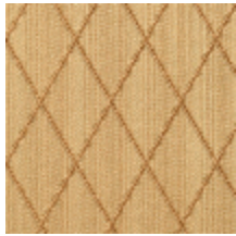
0484-01 FILIN - PEPITE