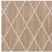
0484-03 FILIN - DUNE