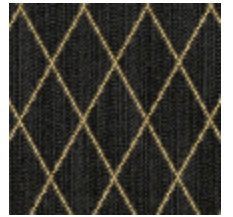
0484-06 FILIN - ONYX