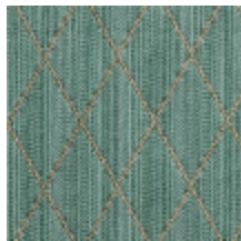
0484-15 FILIN - SAUGE