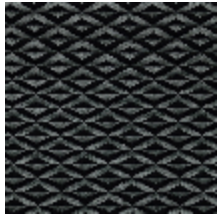
0486-09 ORIGAMI - CENDRE *