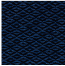
0486-12 ORIGAMI - NUIT *