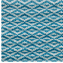
0486-01 ORIGAMI - AQUA *