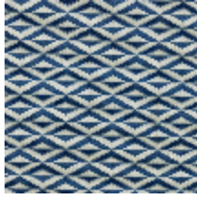
0486-03 ORIGAMI - ROYAL *