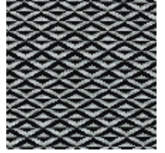
0486-08 ORIGAMI - POIVRE *