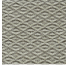
0486-06 ORIGAMI - NATUREL *