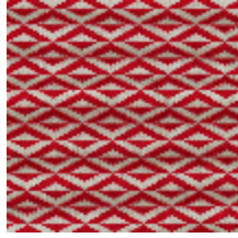
0486-04 ORIGAMI - ROUGE *