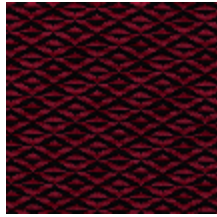
0486-13 ORIGAMI - NECTAR *