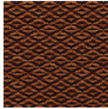
0486-14 ORIGAMI - TERRE *