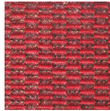
0496-18 KOZO - THÉÂTRE *