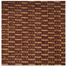
0496-13 KOZO - AMBRE *