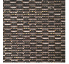
0496-11 KOZO - TAUPE *