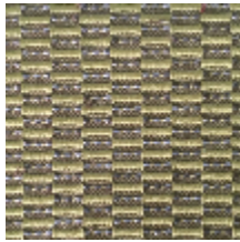
0496-15 KOZO - MOUSSE *