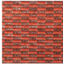
0496-17 KOZO - ROUX *