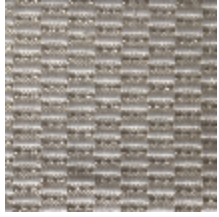
0496-01 KOZO - IVOIRE *