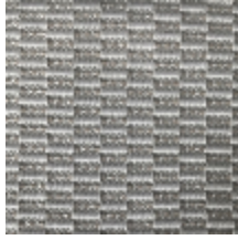
0496-02 KOZO - CRAIE *