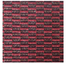
0496-19 KOZO - BIGARREAU *