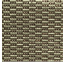
0496-07 KOZO - ROSEAU *