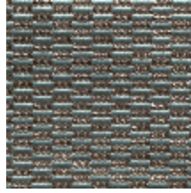
0496-08 KOZO - FJORD *