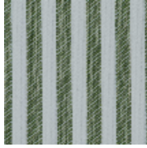
5054-03 ANTILLA - OLIVE