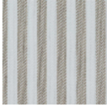
5054-01 ANTILLA - NATUREL