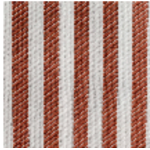
5054-07 ANTILLA - TOMETTE