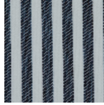
5054-05 ANTILLA - ENCRE