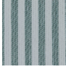
5054-04 ANTILLA - AZUR