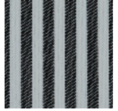
5054-06 ANTILLA - NOIR