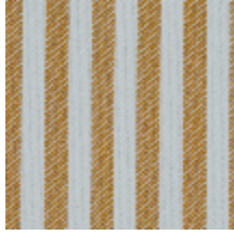
5054-02 ANTILLA - OCRE