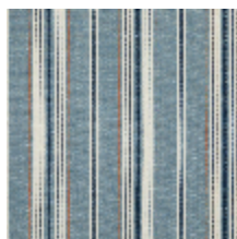
5062-07 DOMINICA - OCEAN