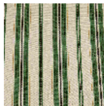
5062-04 DOMINICA - PRAIRIE