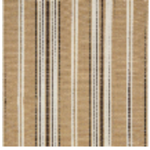
5062-01 DOMINICA - MUSCADE