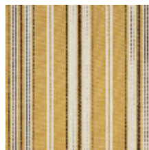
5062-03 DOMINICA - PAILLE