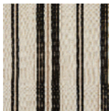
5062-02 DOMINICA - ECRU NOIR