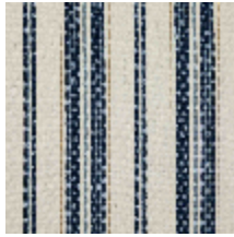
5062-08 DOMINICA - MARINE