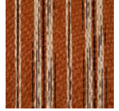
5062-06 DOMINICA - TOMETTE