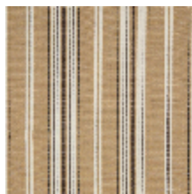
5062-01 DOMINICA - MUSCADE