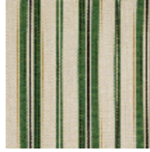
5062-04 DOMINICA - PRAIRIE