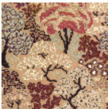
5076-02 LA CANOPEE - CAMEL