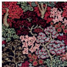
5076-03 LA CANOPEE - NOIR