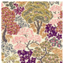
5076-01 LA CANOPEE - ECRU