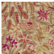
5077-01 LOTUS - EPICES