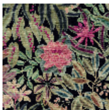
5077-02 LOTUS - REGLISSE