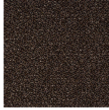
0513-07 MIX - TAUPE *