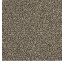
0513-03 MIX - CIMENT