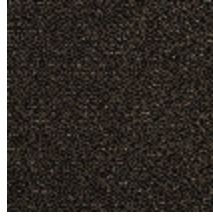
0513-08 MIX - ACIER *