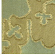
0539-04 ODALISQUE - CELADON