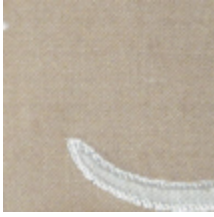
0539-02 ODALISQUE - PERLE