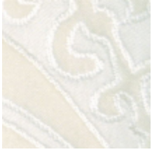
0539-01 ODALISQUE - IVOIRE