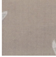
0539-05 ODALISQUE - GORGE DE PIGEON