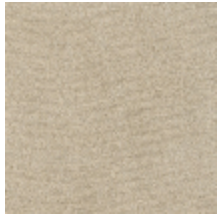
0552-11 FUJI - FICELLE *