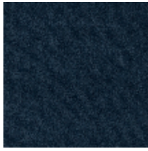
0552-03 FUJI - INDIGO *