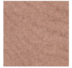
0552-10 FUJI - NYMPHE *