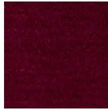
0552-06 FUJI - RUBIS *