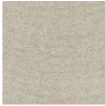
0552-13 FUJI - MASTIC *