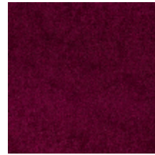
0552-07 FUJI - FRAMBOISE *