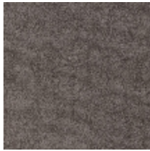
0552-21 FUJI - FUMEE *