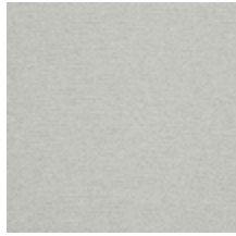
0552-14 FUJI - TALC *