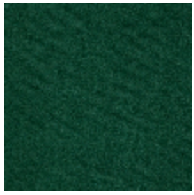
0552-02 FUJI - EMERAUDE *