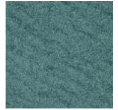
0552-19 FUJI - VERT DE GRIS *