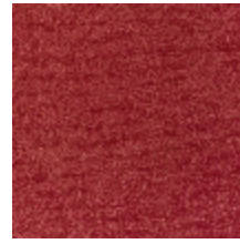
0552-09 FUJI - PIMENT *