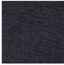
0552-04 FUJI - ORAGE *