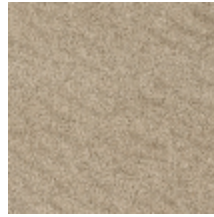
0552-15 FUJI - LIEGE *