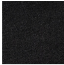
0552-24 FUJI - KHOL *