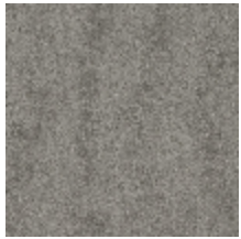
0552-20 FUJI - GRANIT *