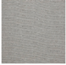
0554-01 KIMONO - RIZ