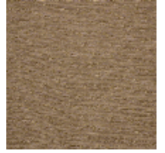
0554-06 KIMONO - COLZA