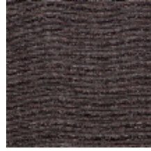
0554-05 KIMONO - ECORCE