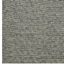
0554-04 KIMONO - FETUQUE