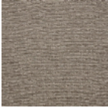
0554-02 KIMONO - LIN