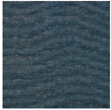
0554-07 KIMONO - CHARDON