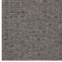
0554-03 KIMONO - POIVRE