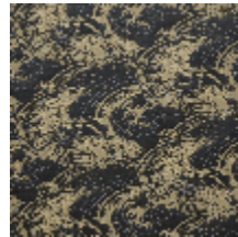
0555-05 NAMI - ETAIN