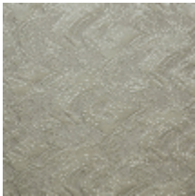
0555-01 NAMI - ECUME