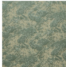
0555-04 NAMI - OPALINE