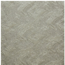
0555-01 NAMI - ECUME *