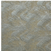
0555-02 NAMI - PLATINE