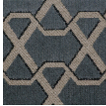
0557-04 RIBON - ETAIN *