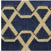
0557-08 RIBON - ORIENT *