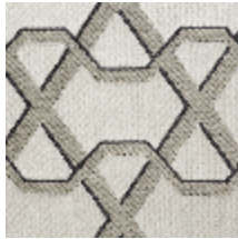
0557-02 RIBON - EMAIL *