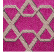
0557-07 RIBON - FUCHSIA *