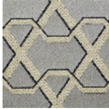
0557-03 RIBON - OPALINE *