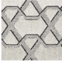
0557-01 RIBON - ARGENT *