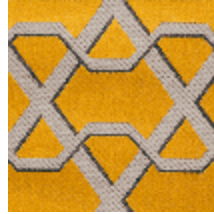
0557-05 RIBON - SOUFRE *