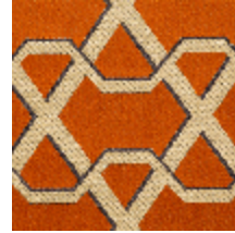
0557-06 RIBON - KUMQUAT *