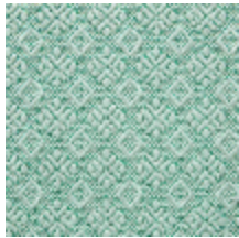
0560-02 COLIBRI - MENTHE *