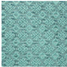
0560-03 COLIBRI - LAGON *