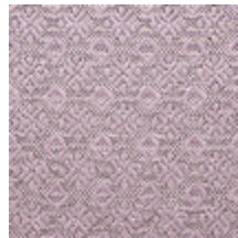
0560-14 COLIBRI - GLYCINE *