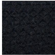
0560-05 COLIBRI - CHARBON *