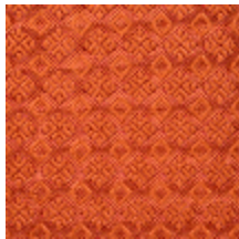
0560-11 COLIBRI - ABRICOT *