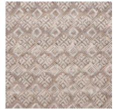
0560-07 COLIBRI - FUMEE *