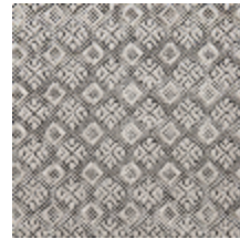
0560-06 COLIBRI - CENDRE *