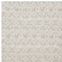
0560-08 COLIBRI - NATUREL *