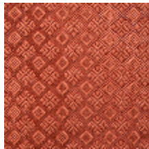
0560-12 COLIBRI - POTERIE *