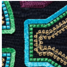
0561-03 KAYAPO - PERROQUET *