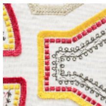
0561-02 KAYAPO – SORBET *