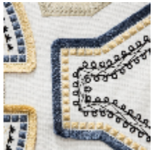
0561-01 KAYAPO - ANTIQUE