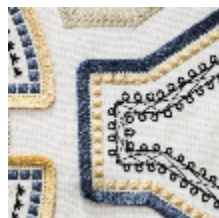
0561-01 KAYAPO – ANTIQUE *