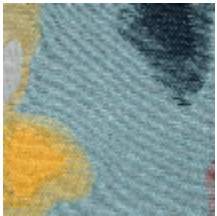
0562-01 BALI - AUREORE