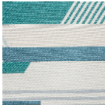
0563-01 GAUCHO - BALTIQUE *