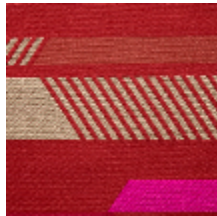
0563-03 GAUCHO - ATLAS *