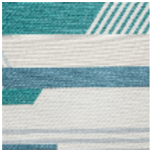
0563-01 GAUCHO - BALTIQUE *