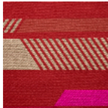
0563-03 GAUCHO - ATLAS *