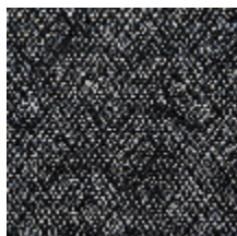
0564-01 LANDE - INDIGO