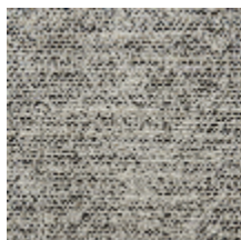
0564-03 LANDE - BREST