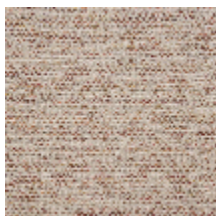
0564-02 LANDE - PIANA