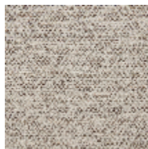
0564-04 LANDE - IBIZA