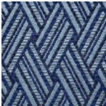
0568-02 VACOA - NAUTIQUE *