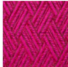
0568-10 VACOA - FUCHSIA *