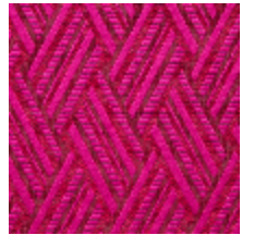
0568-10 VACOA - FUCHSIA *