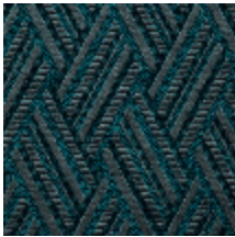
0568-03 VACOA - CANARD *