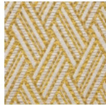
0568-08 VACOA - SOLEIL *