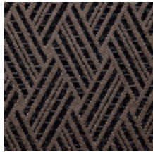
0568-04 VACOA - FUSAIN *