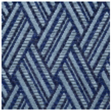
0568-02 VACOA - NAUTIQUE *