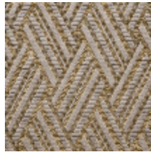
0568-07 VACOA - BRONZE *