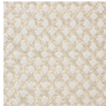
0569-04 QUADRILLE - CREME