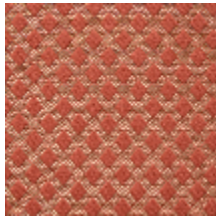
0569-02 QUADRILLE - TOMETTE