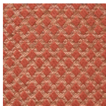
0569-02 QUADRILLE - TOMETTE