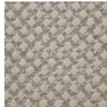
0569-05 QUADRILLE - EMAIL