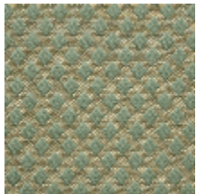
0569-07 QUADRILLE - LAURIER