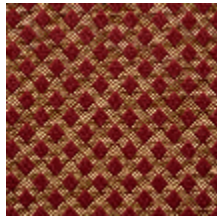
0569-03 QUADRILLE - RUBIS