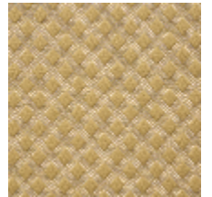
0569-06 QUADRILLE - OR