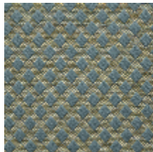
0569-09 QUADRILLE - POMPADOUR