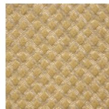
0569-06 QUADRILLE - OR