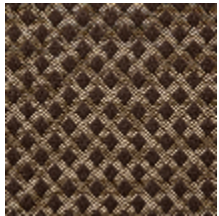
0569-01 QUADRILLE - BRUN