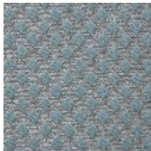
0569-08 QUADRILLE - NATTIER