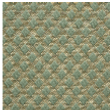
0569-07 QUADRILLE - LAURIER