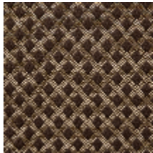
0569-01 QUADRILLE - BRUN