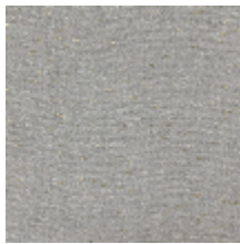
0571-02 CAMARGUE - BRUME