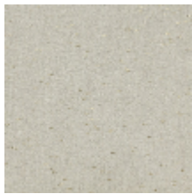
0571-01 CAMARGUE - CHAUX