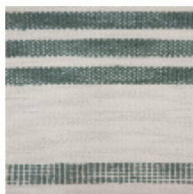
0573-03 MARINA - AGAVE