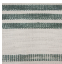
0573-03 MARINA - AGAVE