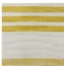
0573-02 MARINA - PASTIS