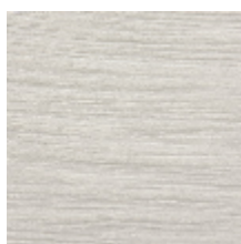
0575-01 RIVAGE - ECUME