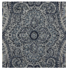
0582-04 PAISLEY – FAÏENCE