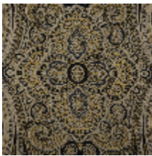
0582-02 PAISLEY – MORDORE