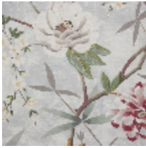
0583-02 PRINTEMPS DE CHINE - AQUA *