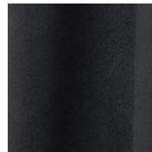
0603-11 DAIM - ARDOISE