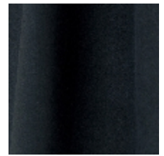
0603-12 DAIM - NAVY