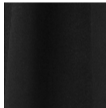
0603-10 DAIM - KHOL