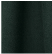
0603-09 DAIM - CEDRE