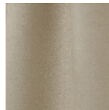
0603-17 DAIM - PIERRE