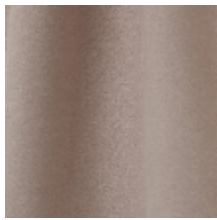
0603-07 DAIM - NUDE