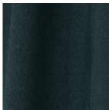
0603-14 DAIM - CANARD