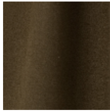
0603-03 DAIM - NOISETTE