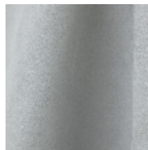
0603-16 DAIM - FUMEE