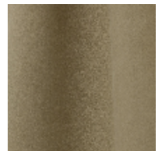
0603-18 DAIM - GINGEMBRE