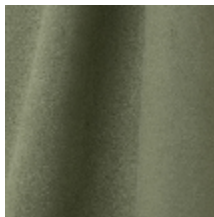
0603-08 DAIM - ARGILE