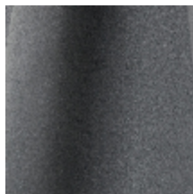
0603-15 DAIM - ALUMINIUM