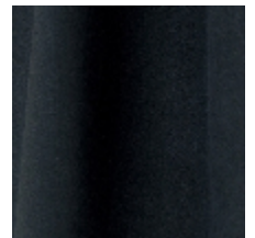
0603-12 DAIM - NAVY