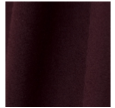
0603-06 DAIM - RAISIN