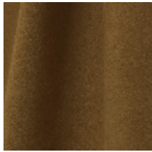
0603-01 DAIM - MORDORE