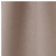
0603-07 DAIM - NUDE