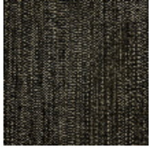
0605-01 PALISSE - FAISAN *