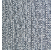
0605-05 PALISSE - HERON *