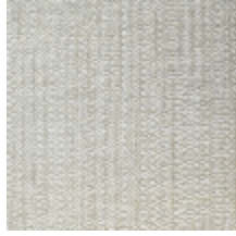
0605-03 PALISSE - AVOINE *