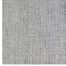
0605-04 PALISSE - CORDE *