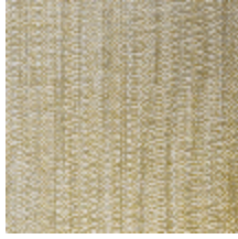
0605-02 PALISSE - CHAUME *