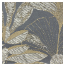
0609-04 HORTUS - ENCENS