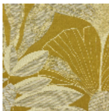
0609-02 HORTUS - RESINE