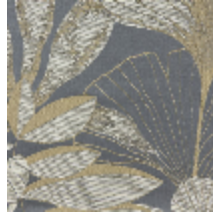
0609-04 HORTUS - ENCENS