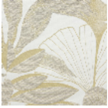
0609-01 HORTUS - KARITE