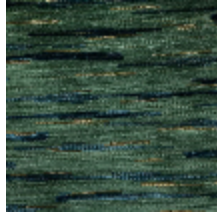
0611-03 MERISIER - EMERAUDE