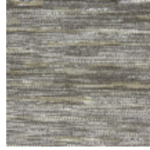
0611-05 MERISIER - ARGENT