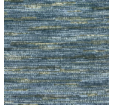
0611-06 MERISIER - CIEL