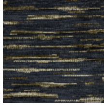
0611-04 MERISIER - FUSAIN